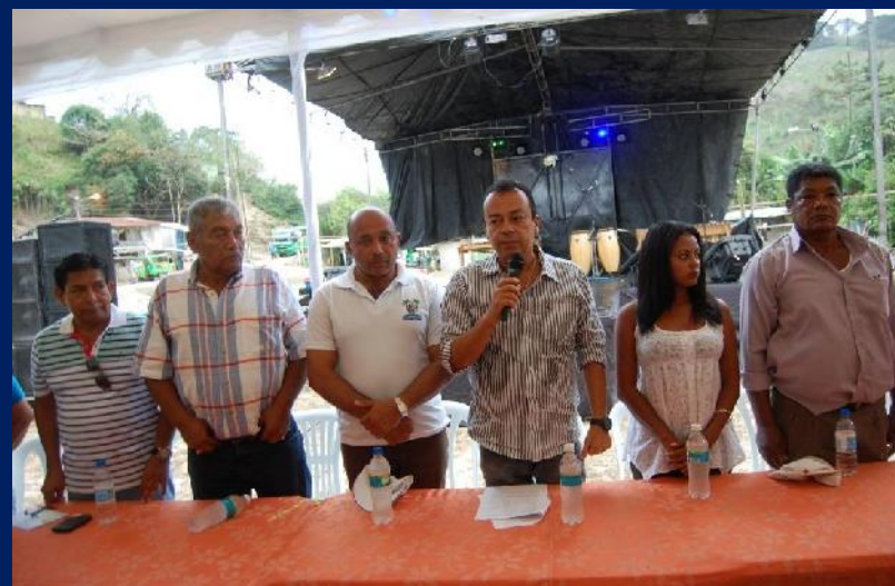
P I E D R A F I N A