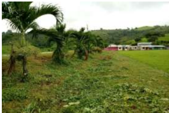
Limpieza de alrededor de la escuela y vía de ingreso al recinto Cumba, parroquia La Unión.