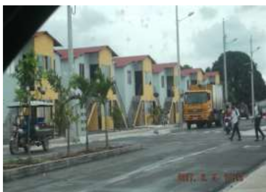
Recolección Desechos Sólidos.