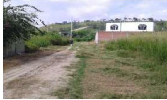
Trabajos de limpieza de área donde funciona el Centro del Adulto Mayor, antigua Aldea de Niños, cabecera parroquial de Atacames.