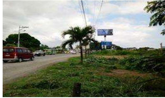
Limpieza de espaldones de las calles de acceso sector Los Guayacanes, parroquia Tonsupa.