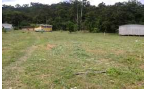
Limpieza de cancha de futbol del barrio San Francisco, recinto Piedra Fina, parroquia Tonsupa.