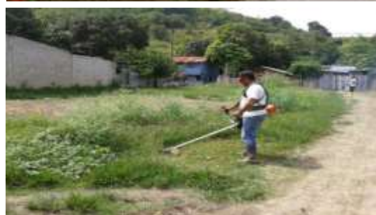
Limpieza de parques y calles de acceso cabecera parroquial Súa.