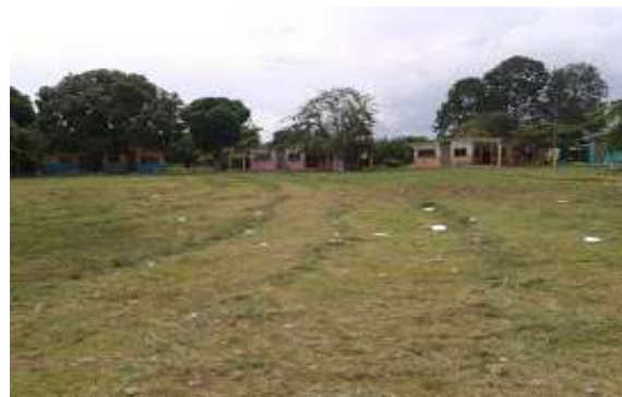
Limpieza de maleza en los alrededores del Colegio Nelson Estupiñán Bass, parroquia Tonsupa.