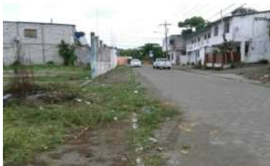
Limpieza de alrededor de la cancha de fútbol de la cabecera parroquial de Súa.