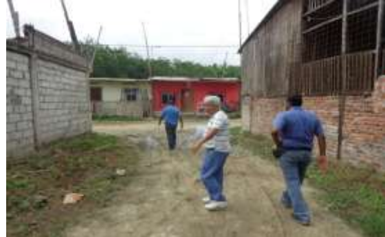
Inspección por denuncia de tala del manglar en el barrio 18 de Febrero de la ciudad de Atacames.