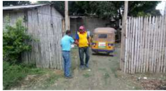
Apoyo a la Jefatura de Calidad Ambiental en Inspección a chanchera en el barrio Alberto Jiménez de Atacames.